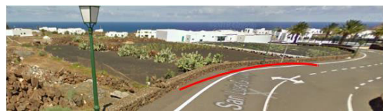
Frente de parcela matriz de proyecto parcelación en Plaza San Luis Gonzaga n.º 15 en LAS BREÑAS

y se identifica el reajuste de las alineaciones del vigente planeamiento (línea de color azul) por la descrita en los siguientes cuadros y delimitada en línea de color rojo con los vértices y listados de coordenadas UTM del levantamiento topográfico realizado en el frente de parcela a dichas calles. Vértices 26 a 43 del lindero a C/ El Arado y vértices 14, 4, 3, 2, 1, 13 y 12 del lindero a Plaza San Luis Gonzaga.