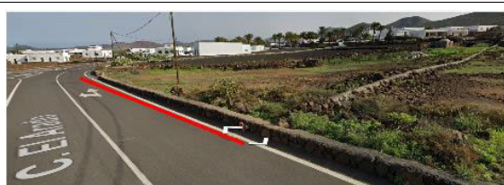
Frente de parcela matriz del proyecto parcelación en calle El Arado n.º 1 en LAS BREÑAS

Como consecuencia de los trámites necesarios para la concesión de Licencia Urbanística de Segregación de parcelas que actualmente se lleva a cabo en el seno del expediente número 232/2024, se realiza la presente acta que justifica el error cartográfico de planeamiento en relación a la realidad existente detectado en los planos de ordenación pormenorizada (OP-10.1 y OP-10.2) del vigente planeamiento, en relación a los linderos de la parcela con frente a calle El Arado número 1 y a la Plaza San Luis Gonzaga número 15 de LAS BREÑAS, T.M. DE YAIZA, tal como se puede apreciar en las imágenes