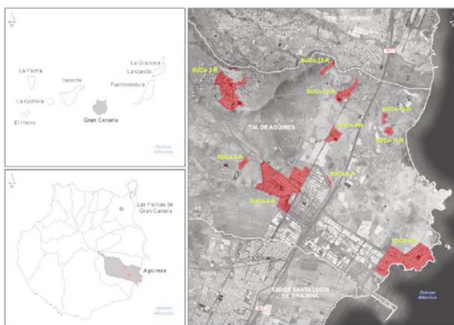
Ámbitos de estudio: localización general de los diez SUCO-R analizados.

La modificación de la ordenación pormenorizada vigente se plantea para posibilitar la implantación del uso terciario (comercial y oficinas) siendo su ámbito de aplicación los suelos urbanos consolidados de uso residencial situados en la costa y delimitados por el vigente 1 Plan General de Ordenación de la Villa de Agüimes, a saber, SUCO-2-R-AGÜIMES, SUCO-3-R-LA GOLETA, SUCO-4-R-CRUCES DE ARINAGA, SUCO-6-R-ESPINALES, SUCO-8-R-PLAYA DE ARINAGA, SUCO-9-R-LAS ROSAS, SUCO-10-R-EL OASIS, SUCO-11-R-EL EDÉN, SUCO-12-R-MONTAÑA LOS VÉLEZ, SUCO-13-R-LA BANDA.