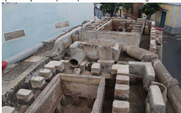
Troneras 2 y 3

Troneras 2 y 3.- Dispuestas sobre elevadas descansando sobre losas independientes de hormigón armado apoyadas en el muro del estanque contiguo y en pilares circulares de hormigón armado. Están ejecutadas en hormigón y mampostería enfoscada. Su técnica constructiva les confiere una antigüedad reciente, segunda mitad del s. XX. Su posición y las numerosas tuberías de reparto en hormigón confieren la imagen característica del conjunto. La tronera 2 mide 2,90 metros de largo por 1,60 metros de ancho. Cuenta con un total de 17 bocas. En el lateral norte se abren 7, 5 de 1 azada, 1 de media azada y 1 de ¼ de azada. En el lado sur, se reparten se abren 7, 5 de 1 azada, 1 de media azada y 1 de ¼ de azada. En el lateral oeste se localizan otras tres bocas de 1 azada cada una. La tronera 3 mide 2,13 metros de largo por 1,56 metros de ancho. Cuenta con un total de 16 bocas. En el lateral norte se abren 6, 4 de 1 azada, 1 de media azada y 1 de ¼ de azada. En el lado sur, se reparten 6 bocas, 4 de una azada, 1 de media y 1 de ¼. En el lateral oeste hay 4 bocas, 2 de 1 azada, 1 de ½ y 1 de ¼. El estado de conservación de ambas es bueno, excepto las losas de hormigón que se encuentran en mal estado por oxidación de las armaduras que en algunos casos aparecen ya vistas por desprendimientos del hormigón. En desuso.